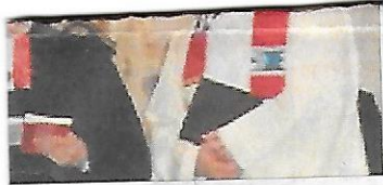
seinen Platz auf der Orgelempore

an das Gelingen zu glauben. Als bekennender FC-Fan müsse er bei diesem Motto aber auch an Fußball denken – auch wenn er angesichts eines einstelligen Platzes vor der Weihnachtspause diesmal die Tabelle nicht auf den Kopf stellen wollte. (rde)